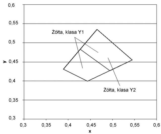
Rys.2. Współrzędne chromatyczności x,y dla barwy żółtej oznakowania